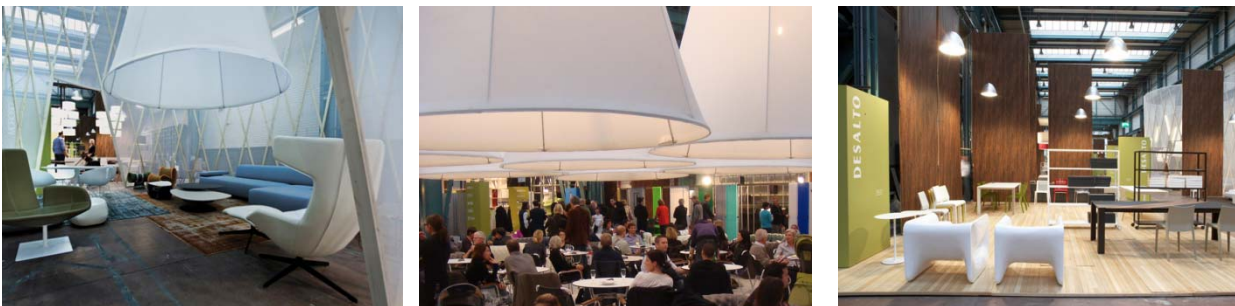
Atmosphäre an „neue räume“

Weitere Sonderschauen, Themenabende sowie Diskussionsveranstaltungen mit Persönlichkeiten aus Design und Architektur ergänzen das Programm von „neue räume 11“ und machen die Ausstellung zum Design-Treffpunkt mit aussergewöhnlichem Ambiente. Für das leibliche Wohl in den verschiedenen Bars, Restaurants und Lounges sorgt an „neue räume 11“ das Gastrounternehmen Hiltl in Zürich. Der Design Shop wird dieses Jahr von der Firma Sibler betreut.