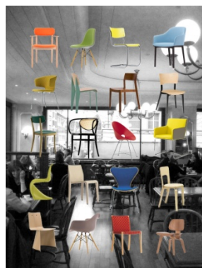
„neue räume“ in città