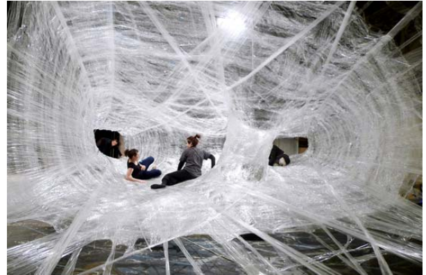
« for use »