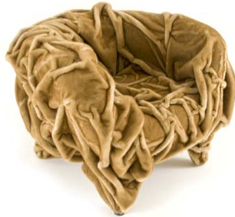
« Fernando et Humberto Campana »