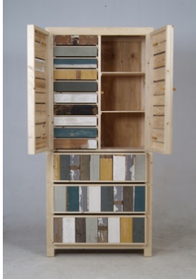
« Piet Hein Eek »

En outre, des expositions spéciales à thème comme « green design », « light », « art and design » et « young labels » occuperont le devant de la scène.