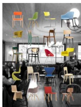
« neue räume » in the City